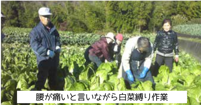
腰が痛いと言いながら白菜縛り作業