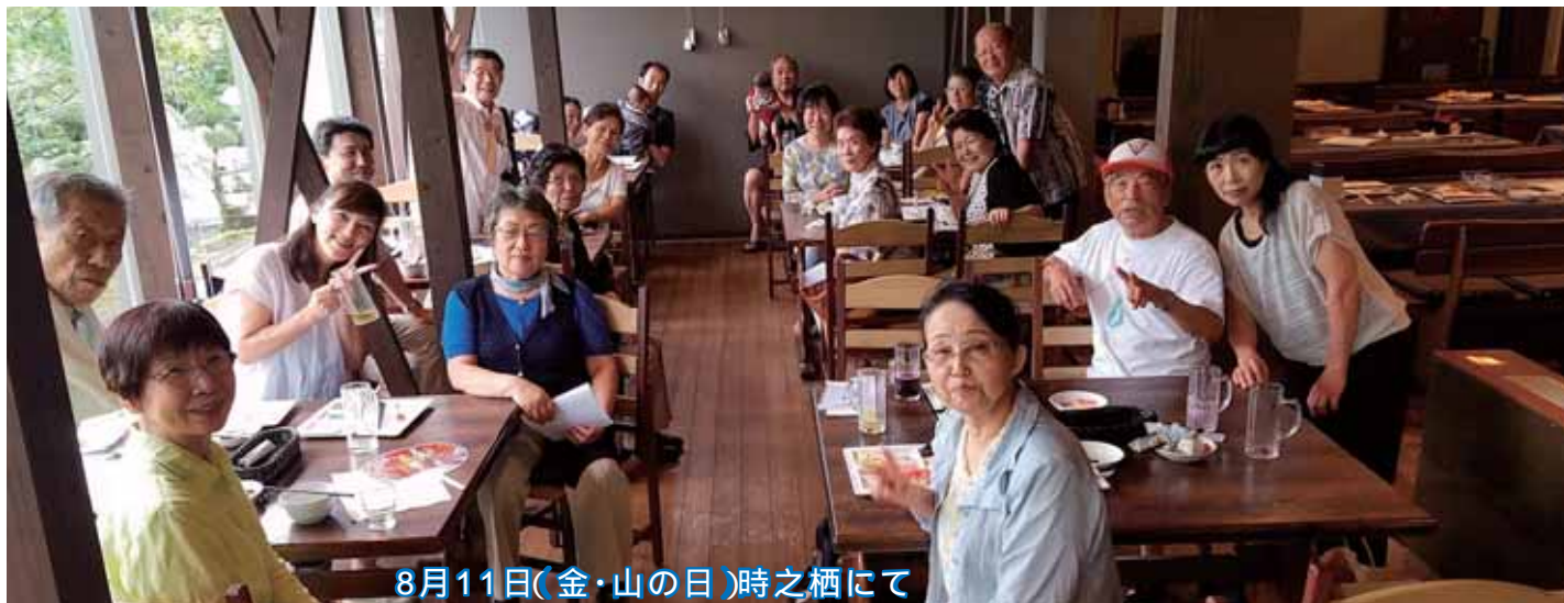
8月11日(金・山の日)時之栖にて