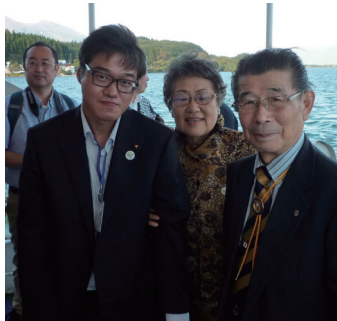
「ワイズメネットのつどい」 猪苗代湖遊覧船にて

僕のモットーになっていて「出来る事を出来るだけ・・・そして、無理はしない」と「面白き無き世も面白く」を基本として、辛い事や楽しく無い事でも、良い面や楽しめる所を見つけていければ良いと思います。そして、日々楽しく生活を送れば良いと思いま