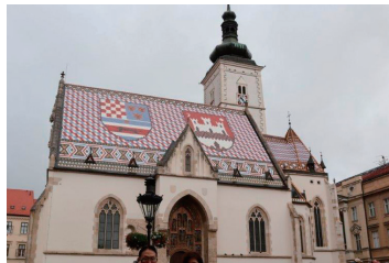
クロアチアのザグレブにて

スロヴェニアのブレッド湖 で首都ザグレブに一泊しまし た。ザグレブでは旧市街の大聖堂・聖マルコ協会など中世 の街並みを見学しました。ザグレブは東欧のなかでも成長 が著しい都市で活気を感じました。そして、今回の観光の 目的であるプリトビチェ湖群国立公園に2泊してゆっくり と湖と滝が織りなす美しい風景を堪能しました。広大な公園 にゴミがほとんどなく、公園の管理がしっかりしている のに感心しまくりでした。エメラルドグリーン湖と自然 の風景は必見だと思えます。その後、アドリア海沿いの街 シベニク・スプリット・トロギールを観光しました。いず れも世界遺産に選ばれた街で紺碧の海とオレンジの屋根の コントラストは美しいものでした。ここで、3ヶ国目のボ スニアヘルツェゴビナに入り、モスタルの街を観光しまし た。車で国境越えに2時間位かかり、貴重な体験をしま した。※モスタルのお話は後編で