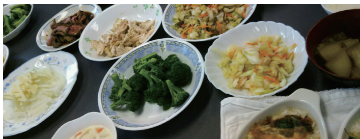
保存食から料理次第でこんなご馳走に