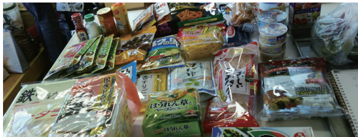
見慣れた保存食を備蓄して使い回します