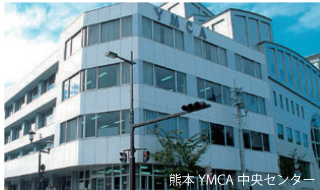
熊本YMCA中央センター

熊本の特長に、「わさもん好き」という言葉がありますが、まさに新しい物好きの方が多くワイズもYMCAに対しての興味津々といったところが原動力です。熊本地震で被害を受けた際にも、みんなで乗り切れたのは、「やってみようかい」の精神で新しいものにチャレンジする気質があるからかもしれません。現在、11のワイズメンズクラブと16の熊本YMCA施設が協働しています。