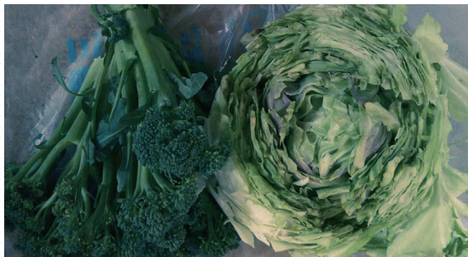
育ち過ぎてしまいました！