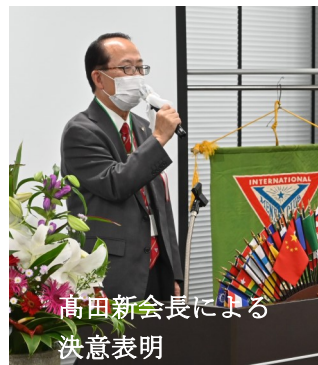
高田新会長による決意表明