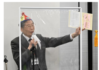
京都ウエストクラブからの祝電の披露