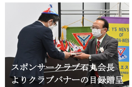
スポンサークラブ石丸会長よりクラブバナーの目録贈呈