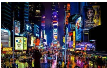
マンハッタンのタイムズスクエアは世界一有名なストリートかも