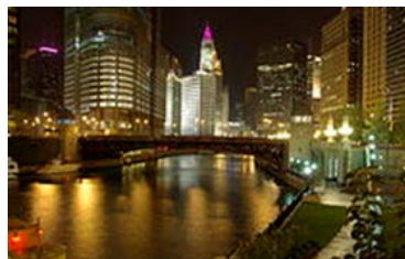
シカゴは夜の街も最高