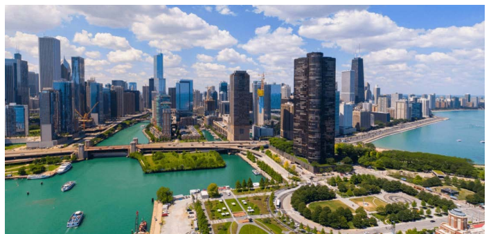
シカゴのダウンタウンは綺麗な街並みです。