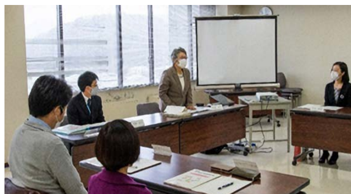
マスクして長時間話すのはかなり息苦しかったです（笑）

第5次男女共同参画基本法では基本目標Ⅰ～Ⅳ（12分野）が示され、そのうち基本目標Ⅰあらゆる分野における女性の活躍（第1分野 政策・方針決定過程への女性の参画拡大、