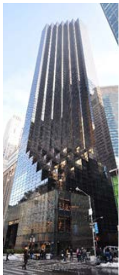
ニューヨークのトランプタワーの一階で Tea Time の想い出

戦争の記念として、リンカーン記念館があり、大都会の中にも静かなヒストリカルプレイスがあったことです。一路、ニューヨークへ飛びましたが、私たちは、以前渡米した際のJFKではなく、ニューアーク空港におりました。ニューヨークには、JFK、ニューアーク、そしてラガーディア空港という国際空港があります。夕暮れ時にニューヨークに降り立つ風景は、何とも言えないものでした。ニューヨークでは、10万人近くの会員がいる、YMCAを案内されましたが、メトロポリタンYMCAにふさわしい規模やシステムに驚きました。セントラルパークの両側には、2つのYMCAがあり、そのYMCAホテルにしばらく滞在しました。セントラルパークを走ったり、メトロポリタン美術館で、ニューヨーカーの気分だけは味わえました。5番外では、有名なティファニーの隣の、トランプタワーの一階で、コーヒーを飲んだことが、今となっては不思議な思い出となっています。