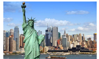
USA といえば自由の女神