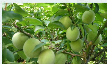
間もなく収穫 (撮影: 5月29日)

実の大きな豊後梅は6月中旬が桃のような香りがし色づき最盛期を迎えます。果肉がたっぷりなのでジャムを作ります。月末に小梅のカリカリ漬けと梅干しに紫蘇を漬込むと水無月の梅仕事がひと段落し、土用に3日間天日干しをして甕一杯の梅干しが完成します。