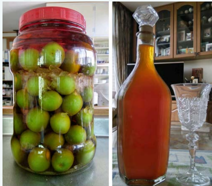
ブランデーベースで梅酒に (撮影: 6月3日)

6月初め、中梅は青いのをブランデー、氷砂糖と赤ザラメで梅酒を漬けます。1粒ひと粒ヘタをとる時間のかかる手仕事です。リタイヤー後は日中にこの作業ができますが、現役時は専ら夜なべと夜明け前の作業でした。出来上がりが楽しみです。3年目頃が