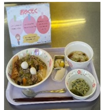
会食ランチ (中華丼セット)