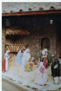
マドリード：街の軒下箱庭のような装飾