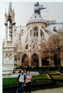
パリ：ノートルダム寺院の日曜ミサを終えて