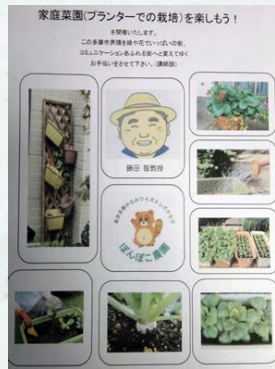
講多摩みなみクラブのお誘い(2021年)