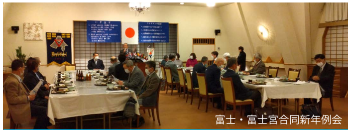
富士・富士宮合同新年例会