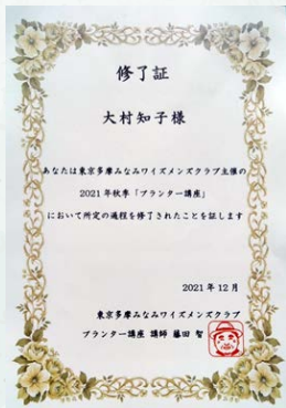
講座終了後、修了証を頂きました。

ワイズ関係者に限定しないので、今回は興味を示した三島市内の友人もZOOM操作からチャレンジして参加し、共に受講・栽培・収穫を楽しんでいます。