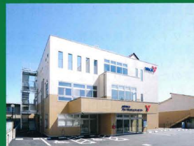
(公財) 山梨 YMACA 新会館