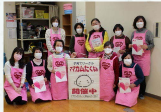
他団体との協働による啓発活動 ※託麻南校区子育てサークル