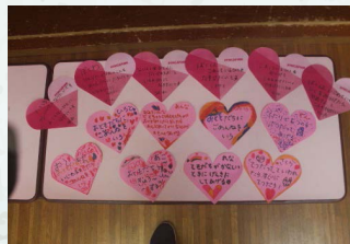
メンバー、学院生、留学生、職員などによるメッセージの作成