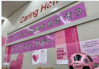
各施設においてポスター掲示やチラシの設置