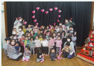
各施設でのメンバーや園児たち保護者へ賛同の呼びかけ